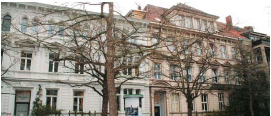
Wohnheim der Caritas in Hannover, Rumannstraße

Die aus den EAEs verteilten Flüchtlinge dürfen sich ohne gesonderte Genehmigung durch die Ausländerbehörde in ganz Niedersachsen und Bremen „bewegen“. Diese sogenannte Residenzpflicht (Einschränkung der Reisefreiheit) wird in Kürze mit Ausnahme der Zeit in einer EAE aufgehoben werden. Es darf Flüchtlingen dann nur noch in ganz wenigen Ausnahmen die Reisefreiheit in Deutschland verweigert werden. Allerdings wird auch zukünftig den Flüchtlingen ein fester Wohnort zugewiesen, und nur dort erhalten sie Sozialleistungen.