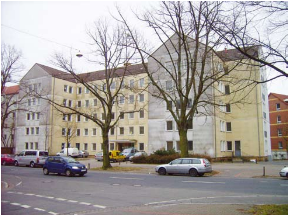
Wohnheim, Hannover, Haltenhoffstraße